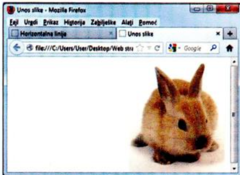
Слика 3.19. Рјешење вјежбе бр. 3.10.

<html> <head> <title> Unos slike </title></head> <body> <img src="zec.jpg" align="right" alt="slike"> </body> </html>