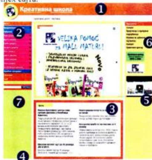
Слика 4. 7. Дијелови Почетне (Home) странице сајта

На врху Почетне (Home) странице требало би да се налази оно што веб корисници требају прво видјети када приступе вашој страници. Због тога је добар избор дизајна важан за успјех сајта.